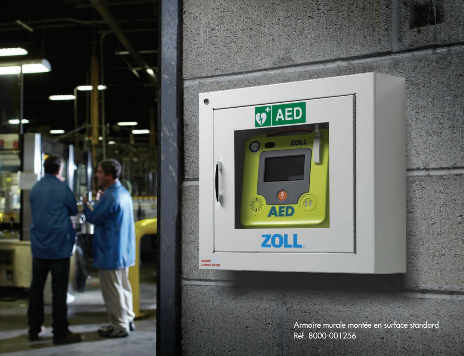
Armoire murale montée en surface standard Réf. 8000-001256