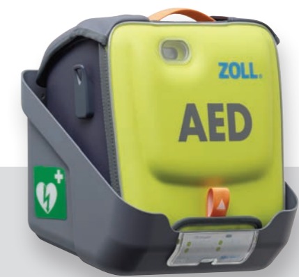
Fixation murale universelle avec le ZOLL AED 3, sa mallette de transport et des électrodes CPR Uni-padz de réserve (dans la mallette de transport) Réf. 8000-001266