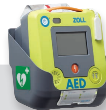
Fixation murale universelle avec le ZOLL AED 3 seul (sans sac de transport) Réf. 8000-001255

La fixation murale universelle sert de support au ZOLL AED 3 seul ou dans sa mallette de transport, et porte une étiquette avec le symbole vert AED ILCOR. Elle comprend du matériel de fixation, une carte de suivi des consommables, un patron de fixation murale et des instructions d'installation.