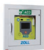
Armoire murale entièrement encastée Réf. 8000-001258