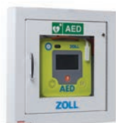
Armoire murale semi-encastée Réf. 8000-001257

Choisissez le modèle monté en surface pour une installation facile, ou bien le modèle semi-encasté ou entièrement encasté pour un rangement moins encombrant. Ces trois modèles comprennent tous un jeu d'étiquettes ILCOR (Comité international de liaison sur la réanimation) pour DAE et des instructions d'installation.