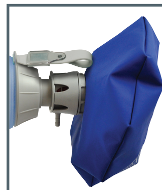
Réservoir O 2 fermé